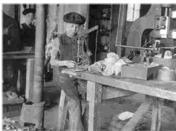
Παιδιά που εργάζονται σε εργοστάσιο το 1908

Η εργασία είναι κοινωνικό δικαίωμα. Η παιδική όμως εργασία συχνά είναι έγκλημα. Για ποιους λόγους ο Ουγκώ στρέφεται εναντίον της παιδικής εργασίας;